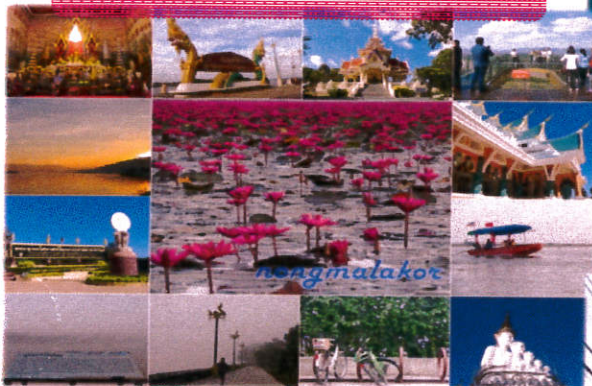
การท่องเที่ยวมาตรฐานสากล