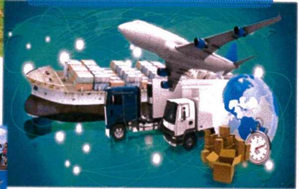
ศูนย์กลางการค้าและโลจิสติกส์