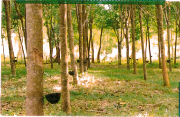
เกษตรอุตสาหกรรมต้นน้ำ